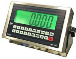
Вторичный измерительный преобразователь WI-19S (ДЭП7)

Класс точности весового индикатора WI-19S (ДЭП7) - III (средний) Функциональные особенности весового индикатора WI-19S (ДЭП7) Жидкокристаллический дисплей (7 сегментов). Установка даты и времени. Исполнение корпуса-нержавеющая сталь Степень пыле-влагозащиты IP-66 Высота символов: 45 мм. Возможность компенсации массы тары во всем диапазоне взвешивания. Режим фиксирования пикового значения массы. Возможность крепления к столу или стене. 2 интерфейса RS-232. Источник питания: сетевой адаптер 12В, 0.5А или встроенный аккумулятор 6В 4Ач Рабочий диапазон температур: от -10°C до +40°C. Габаритные размеры: 250x150x60 мм. Опции Управление внешним приводом для ограничения создаваемого усилия