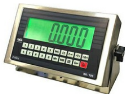
Вторичный измерительный преобразователь WI-19S (ДЭП7)

Класс точности весового индикатора WI-19S (ДЭП7) - III (средний) Функциональные особенности весового индикатора WI-19S (ДЭП7) Жидкокристаллический дисплей (7 сегментов). Установка даты и времени. Исполнение корпуса-нержавеющая сталь Степень пыле-влагозащиты IP-66 Высота символов: 45 мм. Возможность компенсации массы тары во всем диапазоне взвешивания. Режим фиксирования пикового значения массы. Возможность крепления к столу или стене. 2 интерфейса RS-232. Источник питания: сетевой адаптер 12В, 0.5А или встроенный аккумулятор 6В 4Ач Рабочий диапазон температур: от -10°C до +40°C. Габаритные размеры: 250x150x60 мм. Опции Управление внешним приводом для ограничения создаваемого усилия