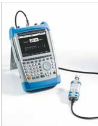
R&S®FSH и датчик поглощаемой мощности R&S®FSH-Z1

Опции FSH-K50E и FSH-K51E добавляют возможность наблюдать диаграмму созвездий различных каналов, производить сканирование эфира на наличие сигналов различных базовых станций (до 8 станций) с отображением мощности канала синхронизации и Cell Id каждой соты. Также доступна индикация использования каналов.