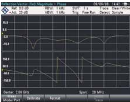
Векторный анализ электрических цепей: отображение амплитуды и фазы