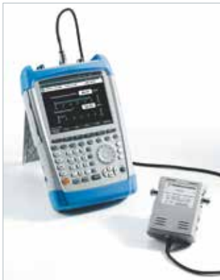
R&S®FSH и направленный датчик мощности R&S®FSH-z44