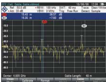
Измерение расстояния до места повреждения (DTF)