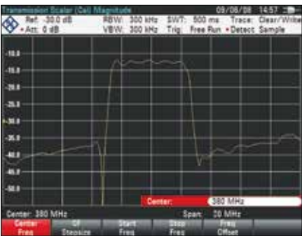
Скалярные измерения передаточных характеристик