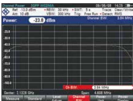
Измерение мощности в канале