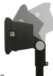
EM-12 Наклоняемое крепление индикатора