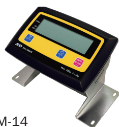
EM-14 Стойка дисплея для размещения на столе/стене