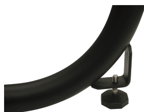
EM-13 Дополнительная опора