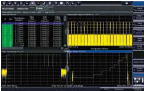
Оснащенный опцией измерения параметров импульсов R & S ® FSW-K6, анализатор R & S ® FSW-K6 позволяет получить характеристики импульсов одним касанием кнопки.