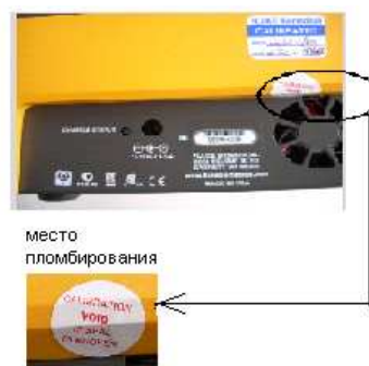
Рисунок 1 – Анализатор Дефибриллятора Impulse 7000DP, внешний вид

Принцип действия анализатора основан на регистрации напряжения и тока на сопротивлении нагрузки с последующим вычислением энергии, амплитудно-временных характеристик импульса и визуализацией на встроенном дисплее.